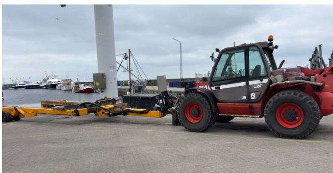
Den vogn, vi skal have, ligner på nogle områder den i Lynæs

Vores medarbejdere og enkelte medlemmer i bestyrelsen har været ude og se på en del forskellige stativer – og håndteringsgrej, da den beslutning, vi nærmer os, er stor og principiel, og der skal investeres store beløb. Vi har en stor landplads, der ikke just er ideel til bådtransport og opbevaring, da den er kuperet og flere steder ret blød. Derfor kan vi ikke nøjes med standardgrej, som bruges i de fleste andre havne. Der er derfor ved at blive konstrueret en bådsvogn specialdesignet til de forhold, der er på vores landareal. Bestyrelsen venter på det endelige tilbud, før den endelige købsbeslutning kan træffes.