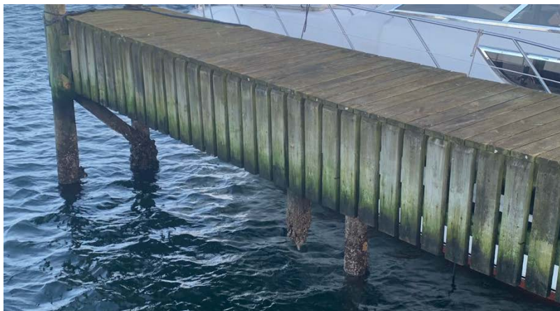
Lavvande sidste sommer åbenbarede denne pæl, der havde mistet jordforbindelsen. Det er siden blevet udbedret, og der har været dykkere i vandet for at tjekke andre steder.

Der er ingen tvivl i bestyrelsens sind: Der skal skiftes broer til efteråret. Vi er i forhandlinger med leverandører, men det er ikke ukompliceret, da priserne skifter i takt med, at oliekrisen udvikler sig, og da der er mange faktorer, der skal tages med i betragtning.