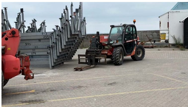
Stablede standardstativer set i Lynæs

for de indskydere, der allerede er på havnen, og som ønsker at gå over til standardstativer. Fremtidens nye indskydere, der fremover kommer til havnen, vil skulle benytte standardstativer.