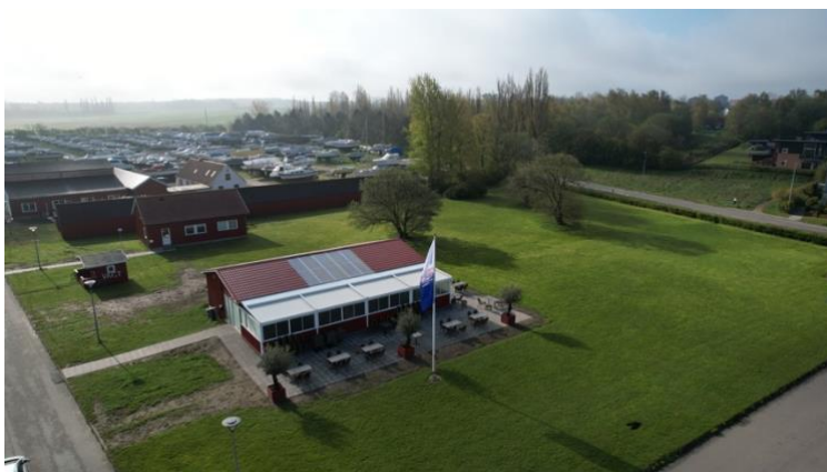
En del af problemstillingen: Må vi have indtægter af udlejning? Vi mener ja, kommunen mener nej...

En afledt effekt af dette er, at det bliver dyrere for os alle at have vores både i havnen, da vi ikke kan supplere vores indtægter og dermed skabe økonomisk stabilitet.